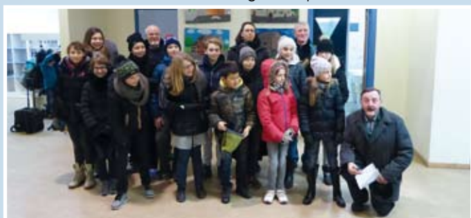
La classe de 6 ème année de l'école communale d'Olne qui a participé à la distribution.

La distribution a été organisée par la CLDR.